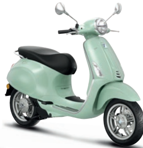
Grün Amabile VK (350/A)