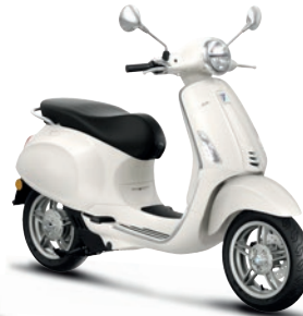
Weiß Innocente B04