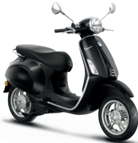
Schwarz Convinto XN2 (98/A)