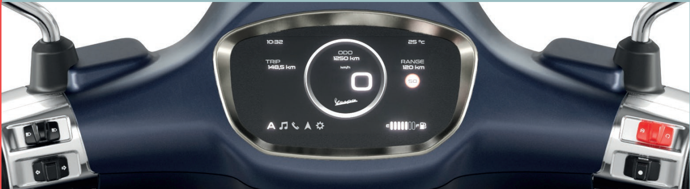
Abb.: Primavera Tech 125