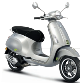
Grau Entusiasta G41