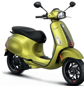
Grün Ambizioso matt V03