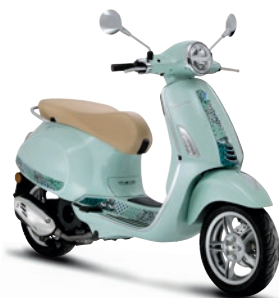
Grün Batik VK (350/A)