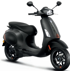
Schwarz Convinto matt NV