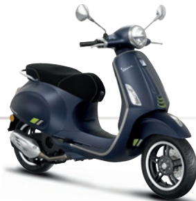
Blau Energico matt DY